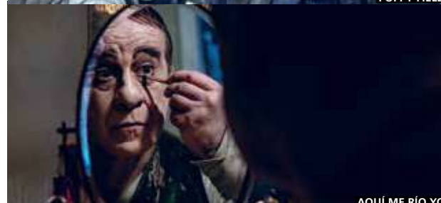
AQUÍ ME RÍO YO