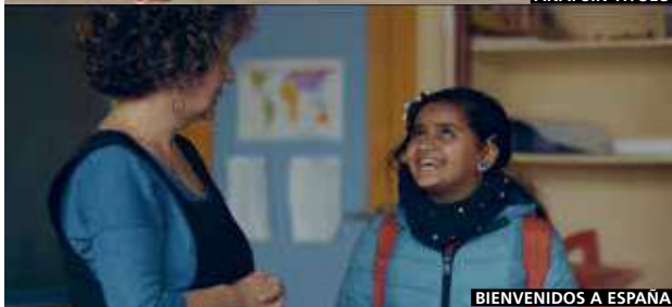
BIENVENIDOS A ESPAÑA