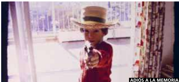
ADIÓS A LA MEMORIA