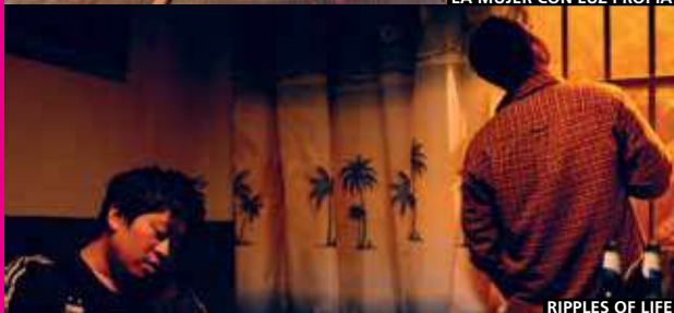
RIPPLES OF LIFE