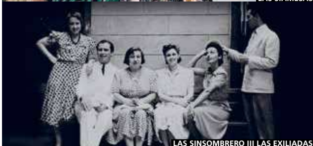
LAS SINSOMBRERO III LAS EXILIADAS