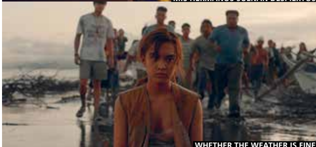
WHETHER THE WEATHER IS FINE