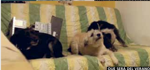
QUE SERÁ DEL VERANO