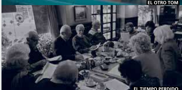
EL TIEMPO PERDIDO