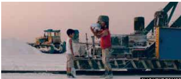
SI LE VENT TOMBE