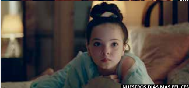
NUESTROS DÍAS MÁS FELICES