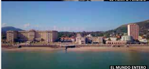
EL MUNDO ENTERO