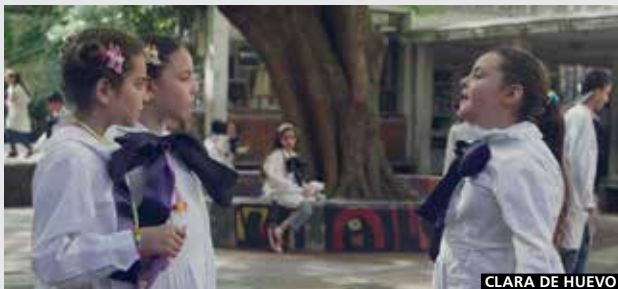
CLARA DE HUEVO