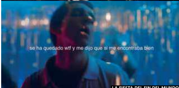
LA FIESTA DEL FIN DEL MUNDO

IN ICTU OCULI (Begiak heste-ko artean) España, 2020. Dir: Jor-