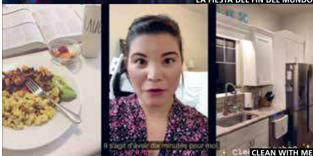
CLEAN WITH ME