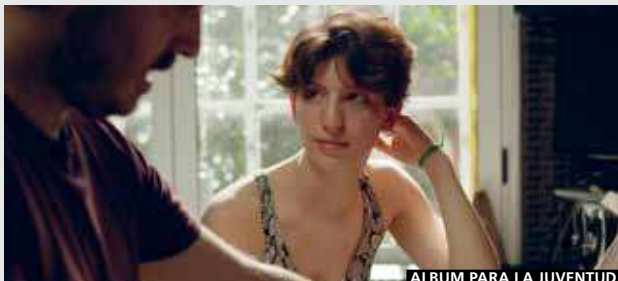
ALBUM PARA LA JUVENTUD