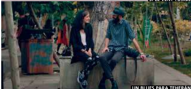
UN BLUES PARA TEHERÁN