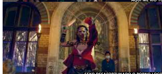
Aquí me río yo