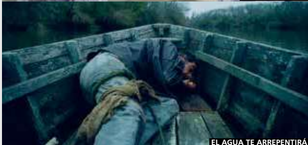
EL AGUA TE ARREPENTIRÁ