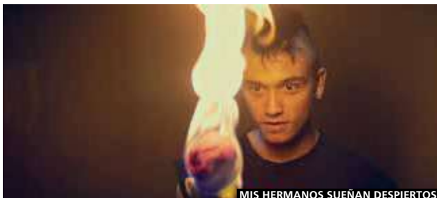
MIS HERMANOS SUEÑAN DESPIERTOS