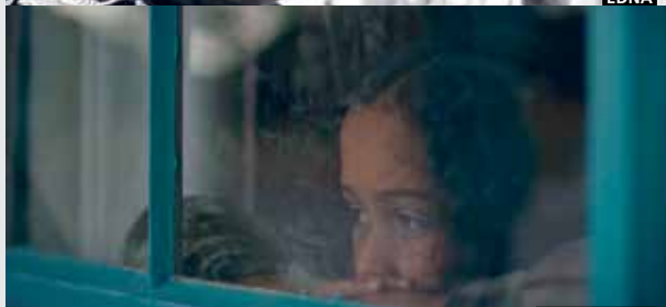
EL OTRO TOM