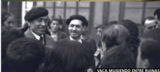
VACA MUGIENDO ENTRE RUINAS

SILE VENT TOMBE Francia, Armenia, Bélgica, 2020. Dir: Nora Martirosyan. Con Grégoire Collin, Hayk Bakhryan, Arman Navasardyan. 100 min. Un auditor internacional francés viaja hasta el aeropuerto de una autoproclamada República Caucásica para evaluar si dar luz verde o no a su reapertura. Un chico local, deambula por el aeropuerto y tiene un extraño negocio. Ambos acaban encontrándose. El resultado no solo logra hacer entender la escala de los temas que explora, sino también da con un buen equilibrio entre un enfoque casi documental y giros narrativos muy dramáticos. (Cinemateca, 9/12)