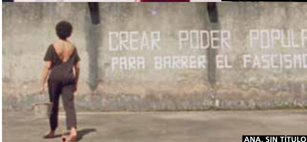
ANA. SIN TÍTULO