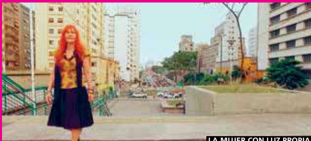
LA MUJER CON LUZ PROPIA