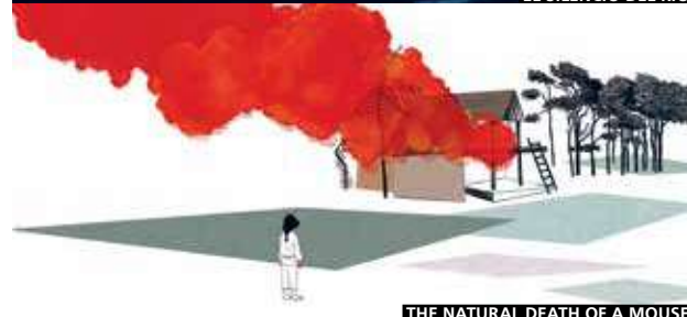
THE NATURAL DEATH OF A MOUSE