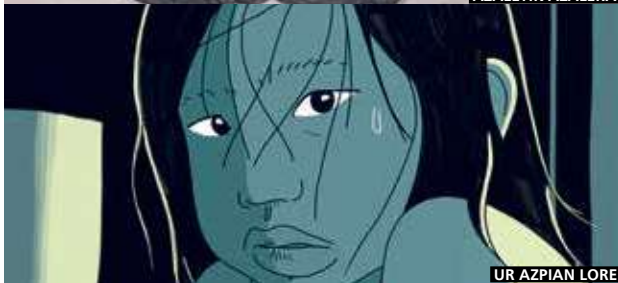
UR AZPIAN LORE

Una selección de la 24ª edición del programa Kimuak de Etxepare Euskal Institutua, gestionado por Euskadiko Filmatagia-Filmoteca Vasca, y que cuenta con el apoyo de Zineuskadi. (Cinemateca, 11/12)