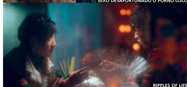
RIPPLES OF LIFE