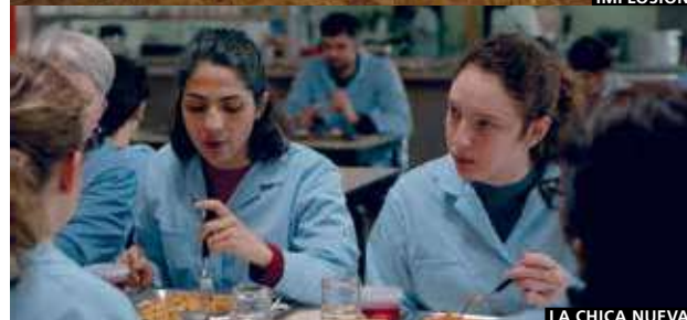
LA CHICA NUEVA