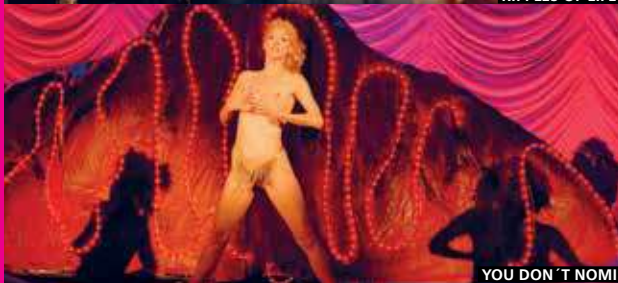
YOU DON'T NOMI

De cine, sobre el cine, alrededor del cine. Esta sección del Festival agrupa un puñado de películas que giran en torno al fenómeno cinematográfico.