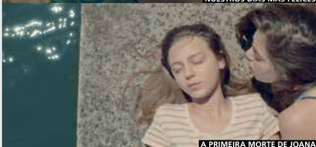
A PRIMEIRA MORTE DE JOANA