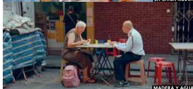
MADERA Y AGUA