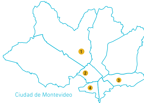
Ciudad de Montevideo

“La tregua” en el ciclo “Cine en Chanquetas”, a exhibirse en versión restaurada por el INCAA en el año 2016, y provista por la Academia de las Artes y Ciencias Cinematográficas de la Argentina, supone un homenaje especial de la ciudad de Montevideo en el centenario del nacimiento de Mario Benedetti .